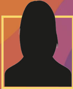
Special Guest LHDN, Malaysia

聚焦企业家与税务、法律专家的多元视角与实践洞察，围绕税务监管、法律风险、人力管理及企业资产与控制权等核心议题，深入探讨其对企业运作与专业实践所带来的关键影响。