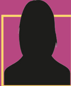
Banker / Financier (TBC)